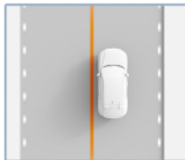
Permanencia en el carril