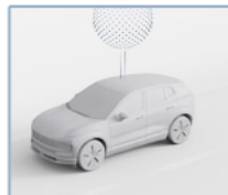
Actualizaciones fáciles de software