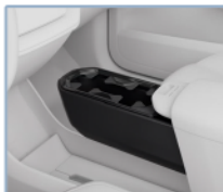
Espacios de carga y almacenamiento versátiles