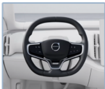
Volante deportivo cuadrado