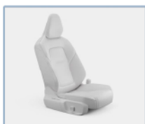
Asientos delgados y ergonómicos