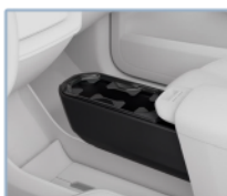
Espacios de carga y almacenamiento versátiles