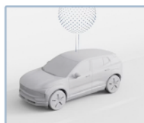
Actualizaciones fáciles de software