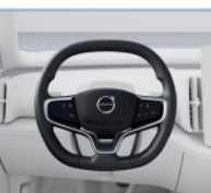
Volante deportivo cuadrado