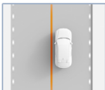
Permanencia en el carril